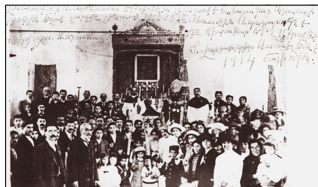
Η πρώτη Θεία Λειτουργία

Κατεβαίνοντας από το ιερό βήμα, υπάρχει ο σολέας ( tass ), ο οποίος διακρίνεται από τον κυρίως ναό με μεταλλικό κάγκελλο. Στα νότια υπάρχει εικόνα που δείχνει τη στιγμή την οποία ο Ιησούς παραδίδει το πνεύμα