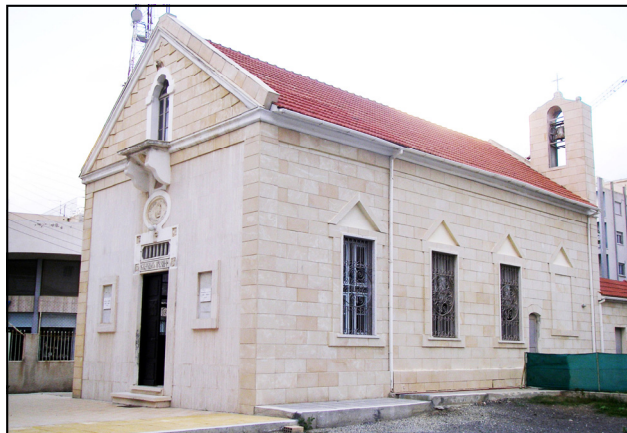
Σημερινή άποψη της εκκλησίας

Ο Καθόλικος (Πατριάρχης) του Μεγάλου Οίκου της Κιλικίας, Sahag II, και ο Μητροπολίτης Αδάνων, Επίσκοπος Yeghishe Garogian έγραψαν τις εισφορές στον έρανο, και στις 9/23 Μαρτίου 1913, η εκκλησιαστική επιτροπή Λευκωσίας με επιστολή της ευχαριστεί τον Καθόλιο Sahag II για τη συνδρομή του στο θεάρεστο αυτό έργο, διαβεβαιώνοντάς τον πως «στο εγγύς μέλλον, το παρεκκλήσι αυτό που είναι αφιερωμένο στην αιδίο μνήμη των πολυάριθμων θυμάτων της Κιλικίας, θα αναδύεται ως αιώνιο μνημείο μπροστά από τα κύματα της Μεσογείου, μέσα στα οποία κοιμούνται τον αιώνιο τους ύπνο τα άτυχα αλλά πάντοτε αθάνατα και αιεί ένδοξα πρόσφατα θύματα της Κιλικίας».